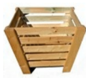
CAJON MACETERO MADERA 080x080 ALT.64 CM.